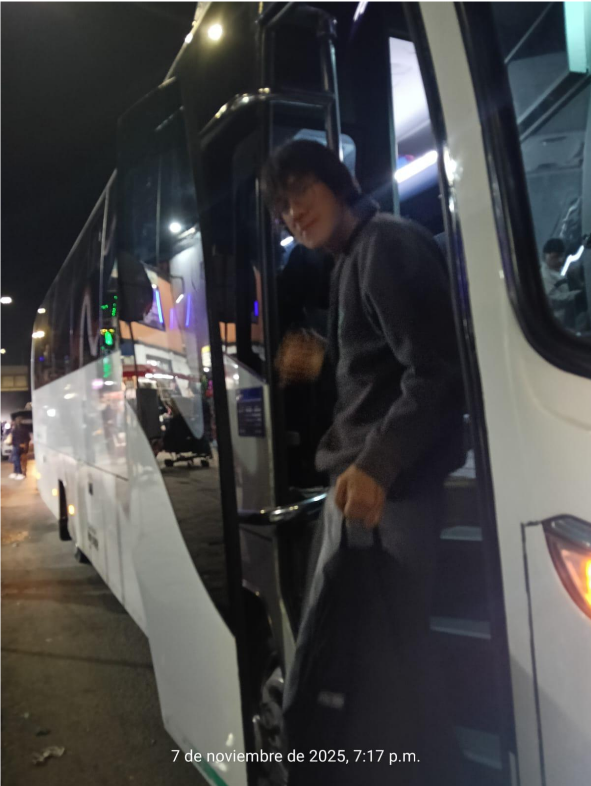
7 de noviembre de 2025, 7:17 p.m.